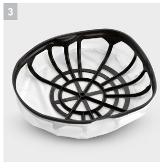
3 Корзина главного фильтра