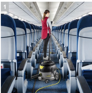
1 Специально для уборки салонов воздушных судов.

Специально разработанная модель для тщательной и эффективной очистки воздушных судов: пылесос для сухой уборки T 12/1 HF работает с бортовым напряжением (110 В, 400 Гц) и предназначен для уборки всех воздушных судов по всему миру.