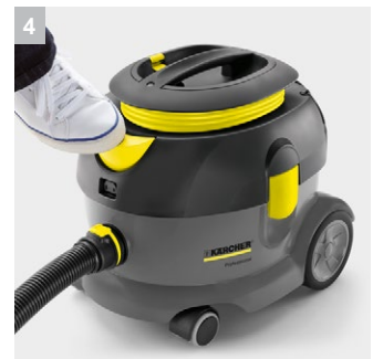
4 Педальный выключатель для дополнительного удобства