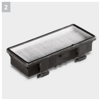
2 HEPA-фильтр для очистки выпускаемого воздуха